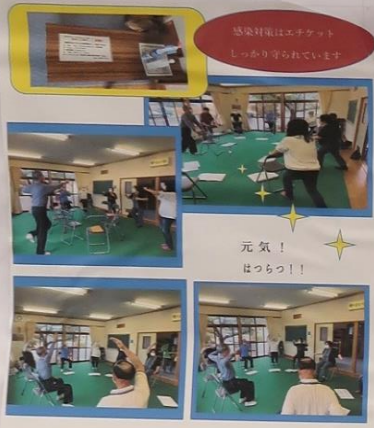
感染対策はエチケット しっかり守られています