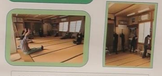
みやまハフツク元気会（御安公民館にて） R4.11.8