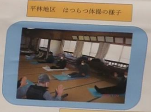
平林地区 はつらつ体操の様子