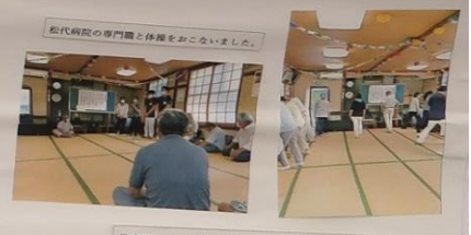
代官町にここクラブ R4.6 体操の様子