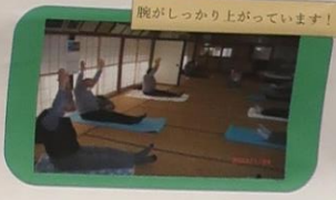
腕がしっかり上がっています！