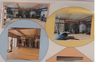
基本的な体操（肩トレ・ストレッチ）と 筋トレも行っています。